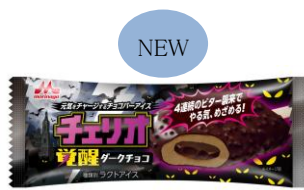
チェリオ 覚醒ダークチョコ 希望小売価格:130円(税別) 内容量:85ml