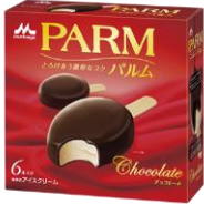
PARM(パルム) チョコレート(6本入り)