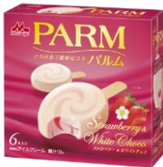
PARM(パルム) ストロベリー&ホワイトチョコ(6本入り)