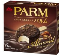
PARM(パルム) アーモンド&チョコレート(6本入り)