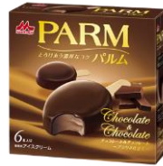
PARM(パルム) チョコレート&チョコレート ~プラリネ仕立て~(6本入り)