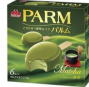
PARM(パルム) 抹茶(6本入り)