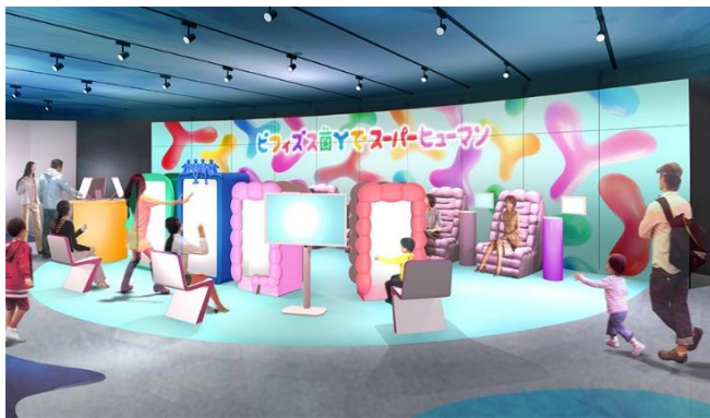
森永乳業展示ブースイメージ (変更になる可能性があります)

この度、メインコンテンツである「手×声×脳波で戦う未来型シューティングゲーム『VR 腸内クエスト』」をはじめ、腸から進化した次世代の人間“スーパーヒューマン”をテーマとした、当社ブースで体験できる全5コンテンツを公開いたします。