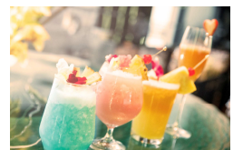
左から, ROYAL BLUE HAWAII, PINK PALACE, ROYAL MAI TAI, PINK