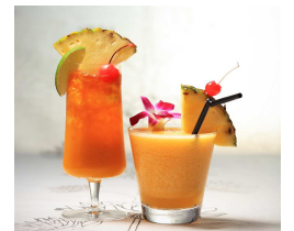
左から, MANGO 5-O, FREDELICO