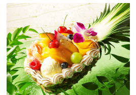
トロピカル ハッピーパインパルフェ