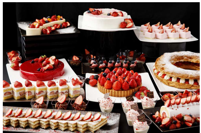
上：AWA LOUNGE 下：Strawberry Sweets Buffet イメージ

※2018年2月10日(土)～14日(水)は様々なショコラスイーツなどが並ぶ「Chocolate &amp; Strawberry Sweets Buffet」を開催いたします。