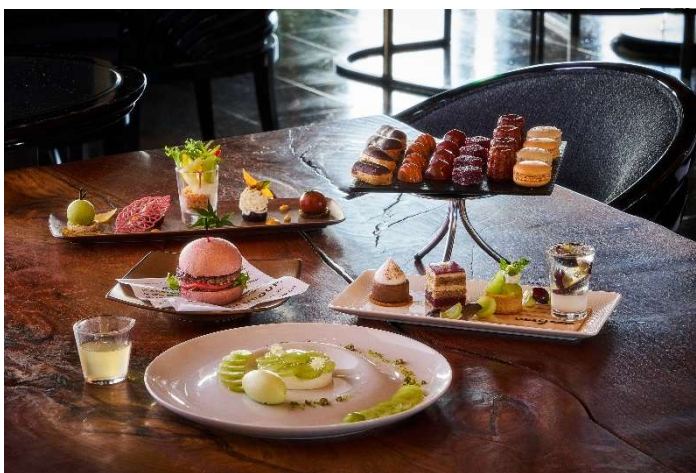
秋のアフタヌーンティースイーツコース「マロン&amp;葡萄」