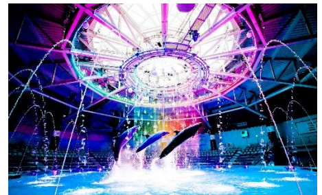
「マクセル アクアパーク品川」ドルフィンパフォーマンス