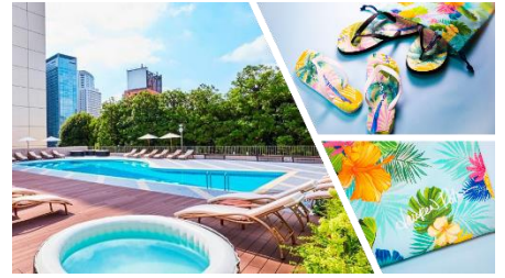
デイプールと品川プリンスホテルオリジナルのビーチサンダルと巾着