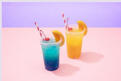
2. ブルーハワイ/ファジーネーブル(アルコール) 各¥1,200