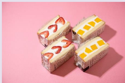
1. フルーツサンド(各1種類ずつ) ¥1,500

5:00P.M.～7:00P.M.の時間限定で、エモーショナルな空間にぴったりの可愛いメニューをご用意いたします。