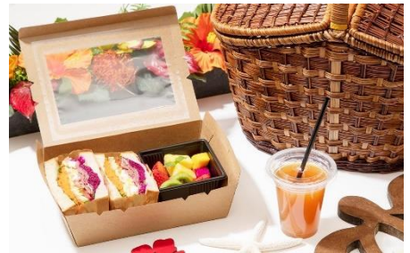
ハワイアンピクニックセット