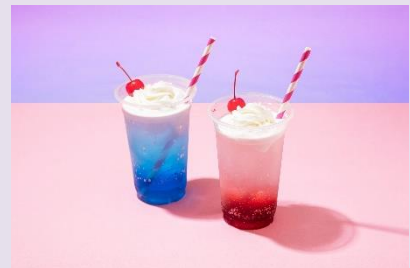
3. クリームソーダ(ブルー/レッド)(ノンアルコール) 各¥1,000

※予告なく提供時間変更の可能性がございます。あらかじめご了承ください。 ※無くなり次第終了となります。