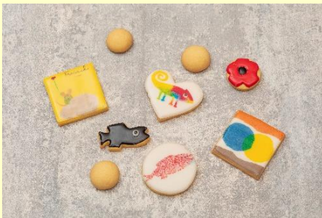
「レオ・レオニズ フレンズのせかい」アイシングクッキー

クリームチーズを詰めた竹炭入りのパンに、フレデリックが手にしているお花をラズベリーとビーツのクッキーで表現しあしらいました。