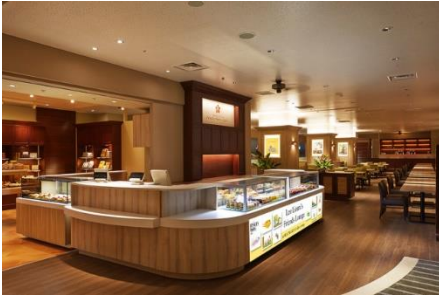
Leo Lionni's Friends LOUNGE at MAUNA KEA Coffee Lounge 店内と商品一覧

レオ・レオニ氏が生み出した多くのキャラクターのイラストを展示したコーヒーラウンジ マウナケアでは“レオ・レオニズ フレンズ”がデザインされた食器を使用したスイーツやフードをご用意いたします。