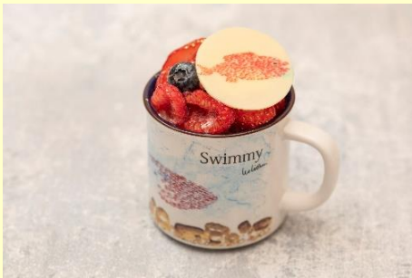
レオ・レオニズ フレンズ「ばふえ」

コーヒーラウンジ マウナケアで人気メニューのアサイーボウルを、『フレデリック』がデザインされた食器でお楽しみいただけます。