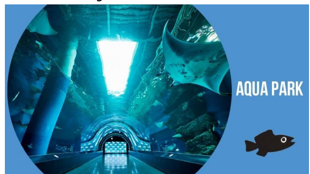
マクセル アクアパーク品川 内観

◎本件に関する報道各位からのお問合せは 品川プリンスホテル マーケティング戦略 TEL: 03-5421-7827(直通) FAX: 03-5421-7893