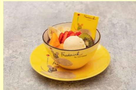
レオ・レオニズ フレンズ「あさいーぼうる」