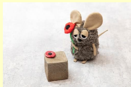
フレデリックの「ぱん」 ※ぬいぐるみはイメージ

※上記内容は、リリース時点(1月28日)の情報であり、営業内容や仕入れ状況により、変更がある場合がございます。※写真はイメージです。※各料金には消費税が含まれております。別途サービス料10%を加算させていただきます。(テイクアウト商品を除く)