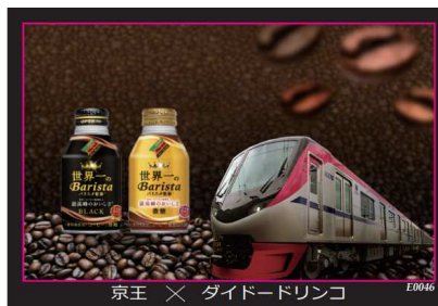
ダイードブレンド 微糖 世界一のバリスタ監修