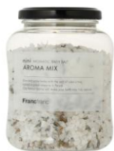
ニニ アロマティック バスソルト アロマミックス ¥1,300 (税込) 全4種