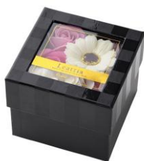
レティシア バスフレグランス フラワーボックス ピンク ¥1,500 (税込)