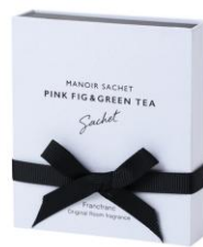
マノワール サシェ ピンクフィグ&グリーンティー ¥1,600 (税込)

花を模した入浴料がボックスにぎっしり入った、使う前も楽しめる入浴料。しかも、使うときにはフラワーバスのように花びらを浮かべて楽しむので、この上なく視覚&嗅覚的に癒されるバスフレグランスですね。