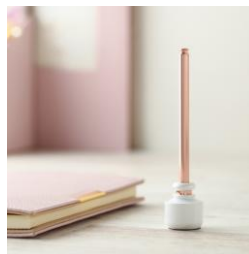
ディップ デスクペン ホワイト ¥3,000 (税込)

プチハリウッドミラー的な、ライト付きミラー。シンプルなデザインなので、どんなテイストの部屋にも違和感なくプラスしてもらえそうです。美しく映るミラーはどんな女性でも貰って嬉しくなりますよね。