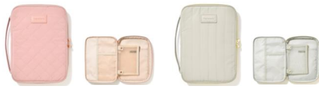
【商品名】キルティング トラベル&タブレットケース 【種類】ピンク／グレー 【価格】各 ¥2,900

広げるとブランケットとしても利用できる便利なネックピローです。ピロー時は高さがしっかりあるため首の安定感が抜群です。移動中もかわいく快適に過ごすことができます。