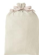
【商品名】ルームウェア トラベルセット ピンク 【価格】 ¥8,500

ワンピース、カーディガン、アイマスク、ルームシューズの旅行時に便利な 4 点セットです。シワになりにくく、よく伸び、肌触りのよい生地感で着心地も抜群です。コンパクトに収納できる巾着付きです。