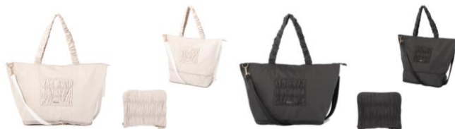
【商品名】クラシックフラワー 2WAY キャリーオントート 【種類】ライトピンク/ダークグレー 【価格】各 ¥4,200

荷物がたっぷり入るトラベル用トートバッグです。一泊二日程度の短期間旅行に最適なサイズ感。背面ポケットのスリット部分をキャリーバッグの持ち手に通して装着できます。使わない時は付属の巾着に入れてコンパクトに保管できます。