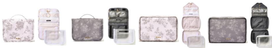
【商品名】クラシックフラワー ハンギングポーチ M・L 【種類】ライトピンク/ダークグレー 【価格】Mサイズ：各 ¥3,500/Lサイズ：各 ¥3,900

ハンガーフックにそのまま吊るして使用できる便利なハンギングポーチです。メッシュのファスナーポケットはコスメや歯ブラシ、ヘアピンなど細々したアイテムの収納にぴったりです。Lサイズは洗面道具だけでなく除菌アイテムやハンカチの替えなども収納できるサイズ感。取り出し可能なクリアポーチはスババッグにもおすすめです。