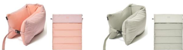
【商品名】キルティング 2WAY ネックピロー 【種類】ピンク／グレー 【価格】各 ¥3,900

広げるとブランケットとしても利用できる便利なネックピローです。ピロー時は高さがしっかりあるため首の安定感が抜群です。移動中もかわいく快適に過ごすことができます。