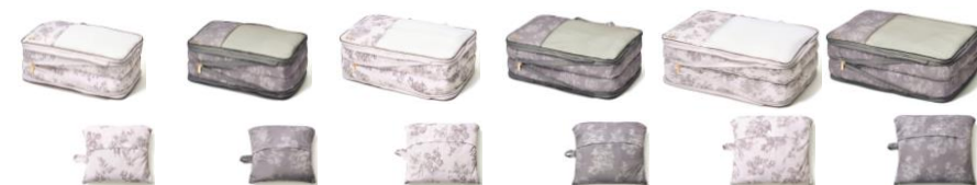
【商品名】クラシックフラワー 圧縮オーガナイザー S・M・L 【種類】ライトピンク/ダークグレー 【価格】Sサイズ：各 ¥2,500/Mサイズ：各 ¥2,700/Lサイズ：各 ¥3,200

かさばる衣類を収納し、ファスナーを閉めるだけで簡単に圧縮できるオーガナイザーです。外側についているファスナーをぐるっと一周半閉じると衣類が圧縮され、衣類をコンパクトに収納することができます。中身が見分けやすい片面メッシュ素材仕様で通気性があり、中は仕切りで二つに分かれているので、着用前後で衣類を分けて収納することもできます。