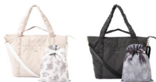
【商品名】クラシックフラワー トラベルバッグ 【種類】ライトピンク/ダークグレー 【価格】各 ¥6,900

荷物がたっぷり入るトラベル用トートバッグです。一泊二日程度の短期間旅行に最適なサイズ感。背面ポケットのスリット部分をキャリーバッグの持ち手に通して装着できます。使わない時は付属の巾着に入れてコンパクトに保管できます。