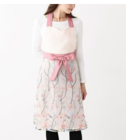
【商品名】チュールフルエプロン ピンク 【価格】¥4,980

ふわっとしたチュールをスカートにあしらったエプロンです。花柄の刺繍と前面のガーリーなリボンが華やかで、お料理をする気分も上がりそう。おもてなしの日にもぴったりなエプロンです。（他、ブラウンの2色展開）