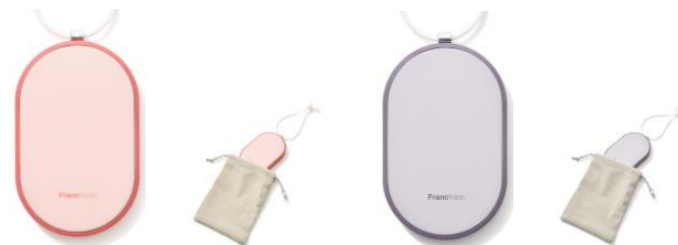
【商品名】繰り返し使えるカイロ 【種類】ピンク/グレー 【価格】¥3,000

充電式で繰り返し使えるので経済的で、モバイルバッテリーとしても利用可能な一台二役のカイロです。ころんとした形がかわいいオーバルの本体は手に馴染みやすく、手のひらサイズで厚さも1.5cmの薄型なので通勤や通学、おでかけする時のミニバッグでもかさばりません。持ち運びに便利な付属の巾着バッグは稼働中に熱さを抑えたい時のカバーとしても使えます。シリコンの紐を手首に通せば、道を歩いている時や電車やバスの座席から立ち上がる時も手元から滑り落ちずに安心です。