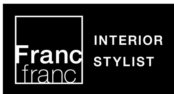
Francfranc Interior Stylist 認定ロゴマーク

家具は、暮らしの中で長く付き合っていくものであり、知識や判断材料がなくては購入しにくいものです。お客様の悩みや不明点を気軽にご相談いただき、インテリアのプロならではの適切な提案で、インテリアを選ぶ楽しさやコーディネートの面白さを感じていただきたいと思います。