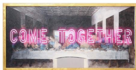
【商品名】COME TOGETHER アートボード 【価格】 ¥ 12,000

ゴッホの「ひまわり」、ミレーの「オフィーリア」、レオナルド・ダ・ヴィンチの「最後の晩餐」をモチーフに、モダンなデザインに仕上げた存在感抜群のアートボードです。いずれもクラシカルな名画を用いながら、あえてポップなメッセージやグラフィティをプラスすることで、都会的なアートに仕上げました。