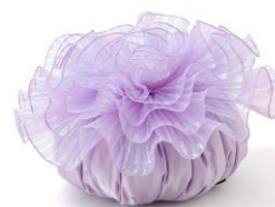
【商品名】シーアネモネ クッション 【種類】ミント/ライトパープル 【価格】¥3,800

イソギンチャクをイメージした、ボリューム感のあるインテリアクッションです。オーロラのようなキラキラとしたフリル生地の華やかなデザインが特徴で、春夏の明るいインテリアシーンのポイントになります。