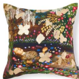
【商品名】アートPT-B-146 マルチ