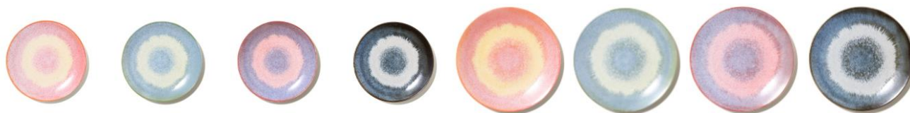
【商品名】ニュアン プレート S/M 【種類】ピンク/グリーン/パープル/グレー 【価格】Sサイズ：¥800/Mサイズ：¥1,000