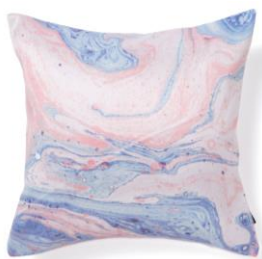
【商品名】マーブルPT-B-137 マルチ

インクの滲みのようなマーブル柄に部分的にメタリック糸で刺繍を施したデザインです。