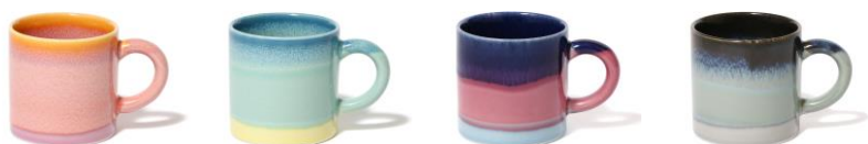
【商品名】ニュアン マグ 【種類】ピンク/グリーン/パープル/グレー 【価格】¥1,200