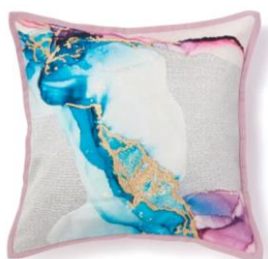
【商品名】EMB マーブル-139 マルチ

イソギンチャクをイメージした、ボリューム感のあるインテリアクッションです。オーロラのようなキラキラとしたフリル生地の華やかなデザインが特徴で、春夏の明るいインテリアシーンのポイントになります。