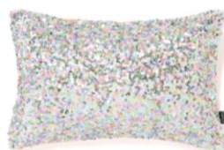
【商品名】メタリックспанコール-140 マルチ

ミレーの絵画「オフィーリア」をモチーフにカラフルな花々のプリントとメタリックプリントを施した華やかなデザインです。