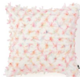
【商品名】リボンアップリケ-138 マルチ

色味の鮮やかなマーブルプリントを施したデザインです。艶感のある生地にプリントしたことで、軽やかな印象に仕上がっています。