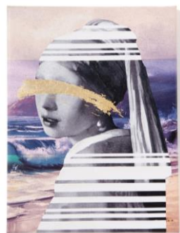
【商品名】ミュージアム アートボード D/E/F 【価格】 ¥ 2,500

「モナリザ」、「グラハム夫人」、「真珠の耳飾りの少女」をモチーフにデザインしたキャンバス素材のアートボードです。ポップでモダンなデザインが、お手頃な価格でお楽しみいただけるシリーズです。