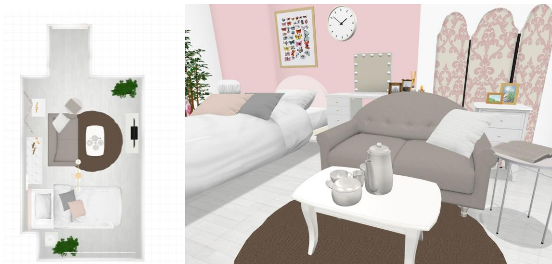
オンラインインテリア相談 画面イメージ（1Kの場合）

オンライン接客サービス予約ページ： https://francfranc.com/blogs/feature/online_interior_consultation