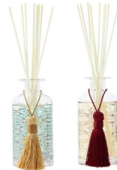
モロッコのミントティグラスを思わせる 華麗な透かし模様のフレグランス。 アジュール ルームフレグランス ¥3,000