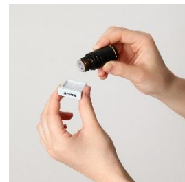
上下の風向きを調整できるようになり、さらに快適に。 デスクに置けるミニサイズも。アロマオイルを使えば、お部屋にいい香りが広がります。 DC スリムタワーファン ¥13,800 / DC ミニタワーファン ¥6,800