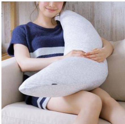
ロングクッション ¥3,500

抱き枕として、授乳クッションとして、マルチに使えるので、昨年から妊婦さんを中心に人気のクッションです。もちもちの触感で、360度伸縮性があるため、からだにしっかりフィットします。