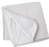
サマーブランケット ¥6,000

接触冷感素材Q-MAX 値0.358(0.2以上が接触冷感)を使用した、毎年人気の接触冷感素材の寝具。男女問わず使いやすいオーナメント柄をデザインしました。丸洗い可能なのでお手入れ簡単、清潔な状態を保てます。(一部商品を除く)