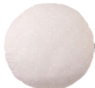
マシュマロクッション ¥2,500