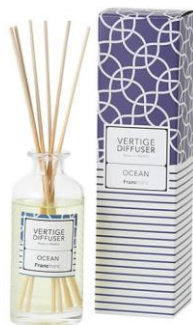
フランス製の特別なフレグランス。 夏はオーシャン、フルーツ、グリーンの香りで。 ヴェルティージュ ルームフレグランス ¥3,800