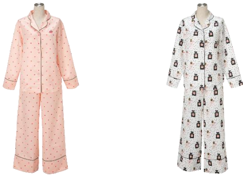
【商品名】BBH パジャマ 【種類】全2種 (左から) CHERRY/PERFUME 【価格】各 ¥6,000 (税込)

チェリーのドット柄と、大胆なパフューム柄がキュートなパジャマです。巾着入りなので旅行時などの持ち運びにもおすすめです。