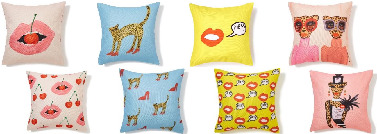
【商品名】BBH クッションカバー (45×45cm) 【種類】全4種 (左から) CHERRY & LIP/LEOPARD/HEY!/TWIN LEOPARD 【価格】各 ¥2,500 (税込)

“手軽に取り入れられるアート”として、アートボードと同柄のクッションカバーを展開します。 裏と表で異なる2種のデザインを楽しめます。