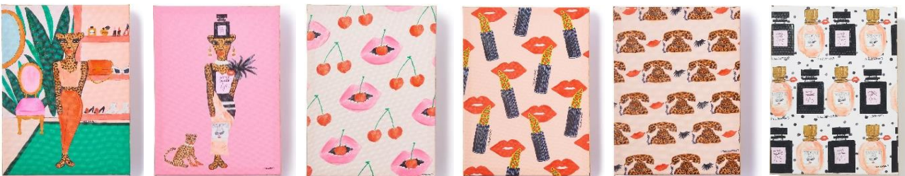
【商品名】BBH アート (W30×H40cm) 【種類】全6種 (左から) STYLISH LEOPARD/FASHIONABLE LEOPARD/CHERRY LIP PATTERN/ LIPS/LEOPARD PHONE PATTERN/PERFUME 【価格】各 ¥3,000 (税込)

※価格はすべて税込みです。※商品名、価格、仕様、発売期間等は変更される場合がございます。