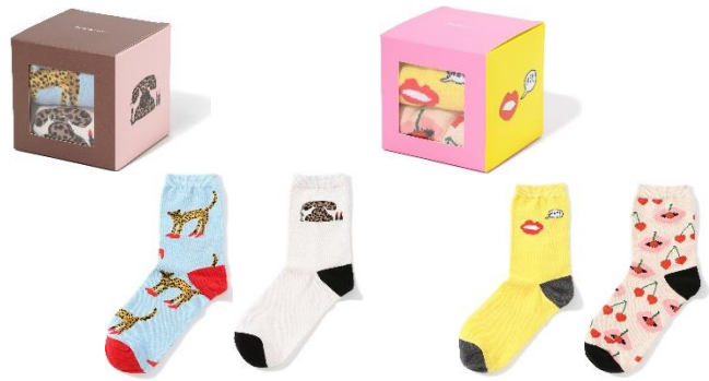
【商品名】BBH ソックスセット (2足1セット) 【種類】全4種2セット (左から) LEOPARD/LIP 【価格】各 ¥1,800 (税込)

チェリーのドット柄と、大胆なパフューム柄がキュートなパジャマです。巾着入りなので旅行時などの持ち運びにもおすすめです。