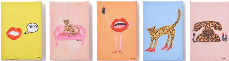
【商品名】BBH アート (W20×H30cm) 【種類】全5種 (左から) HEY!/LEOPARD ON THE SOFA/STANDING LIP/LEOPARD WEARING HEEL/LEOPARD PHONE 【価格】各 ¥2,000 (税込)