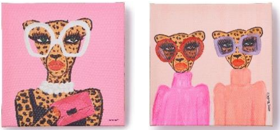
【商品名】BBH アート (W30×H30cm) 【種類】全2種 (左から) LEOPARD WEARING THE GLASS/TWIN LEOPARD 【価格】各 ¥2,000 (税込)

キャッチーでトレンド感のあるモチーフアートは、アート初心者でも気軽に飾っていただきやすい小ぶりなサイズです。