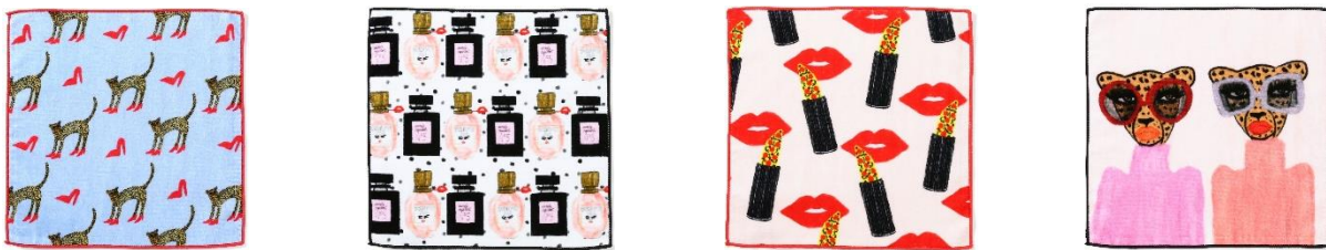
【商品名】BBH ハンカチタオル 【種類】全4種 (左から) LEOPARD HEEL/PERFUME/LIPS/TWIN LEOPARD 【価格】各 ¥700 (税込)