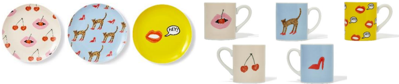
【商品名】BBH プレート 【種類】全3種 (左から) CHERRY & LIP/LEOPARD/HEY! 【価格】各 ¥1,000 (税込)

“手軽に取り入れられるアート”として、アートボードと同柄のクッションカバーを展開します。 裏と表で異なる2種のデザインを楽しめます。