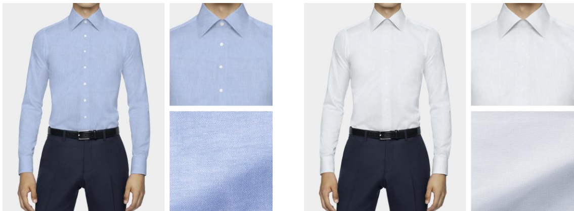
シャツオーダーイメージ