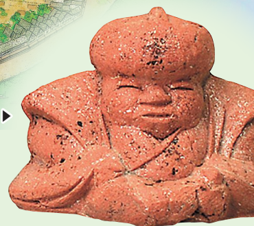
土人形 (近世新潟町跡・新潟市文化財センター蔵) ▶