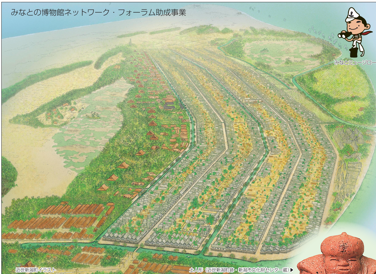
近世新潟町イラスト