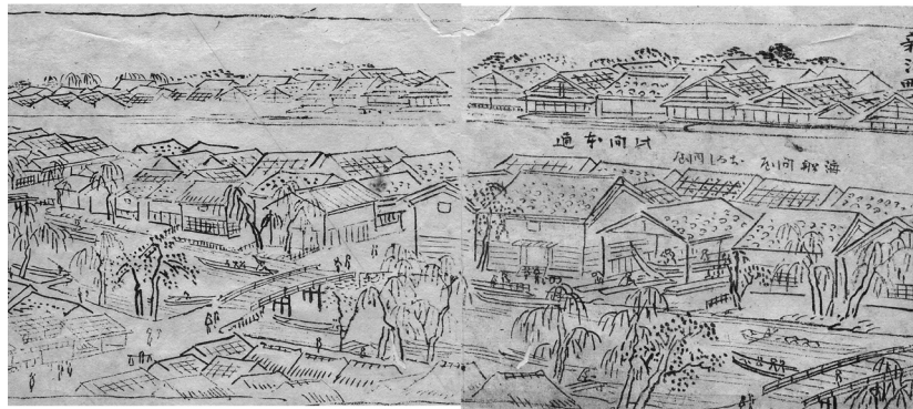
江戸時代の新潟町の町並み〔『北国一覽写』長谷川雪旦 原本:天保二(1831)年 当館蔵〕