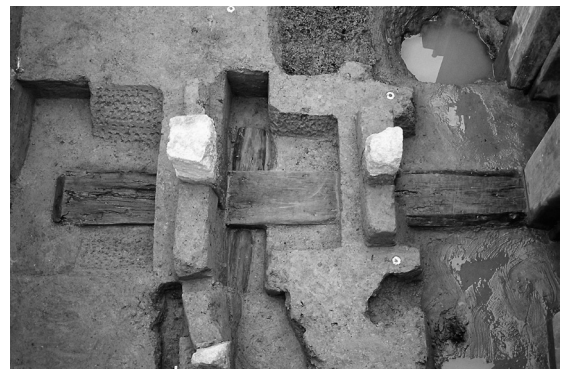
江戸時代の屋敷跡(近世新潟町跡・新潟市文化財センター提供)