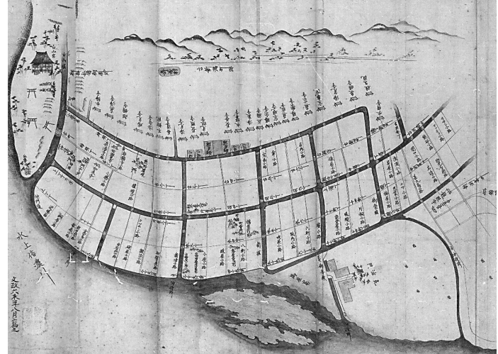
新潟町絵図〔文政六(1823)年 当館蔵〕部分