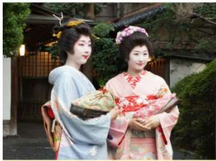
古町芸妓 新潟の伝統文化