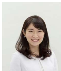
NHK 新潟放送局アナウンサー