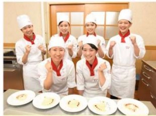
パティシエの卵 新潟の次世代

新潟の伝統文化である古町芸妓と、新潟の次世代を担うパティシエの卵にいがた食育・保育専門学校えぶろんの生徒が協働で“みなとまち新潟”をテーマとしたスイーツを開発。スイーツを通じて、みなとまち新潟の魅力を伝えます！他にも菓子工房などとタイアップし商品化も探ります。まち歩きのお供やお土産として活用できるようにします。