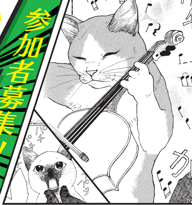
イラスト協力：木村 由美（第23回にいがたマンガ大賞受賞者）

2021年 〈午前11時～午後4時〉 11月28日 日・12月4日 土・12月5日 日