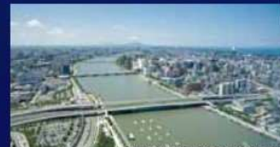
Befcoばかうけ展望室からの景色

紹介ルートの中には日本海側では珍しい水底トンネル、川面に架る石造りのアーチが美しい萬代橋、さらに日本海の景色も車窓からご覧頂けます。新潟市長の台所「ピアBandai」でのお買い物も楽しみ下さい！