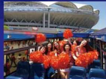
写真はすべてイメージです。