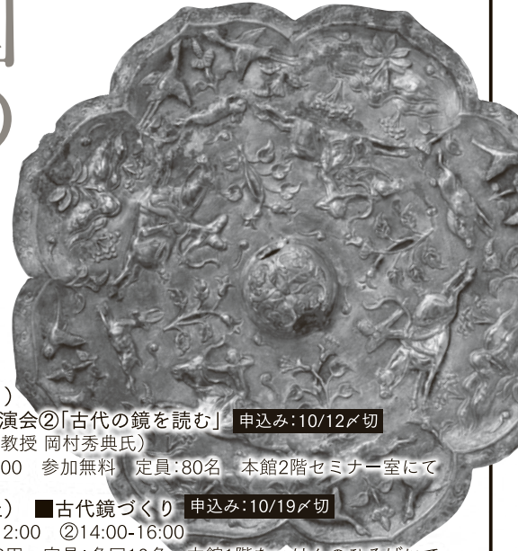
八弁形狩猟紋銀鏡背(唐)