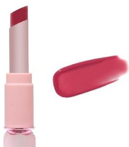
ピンクの願い 愛らしいヌードピンク