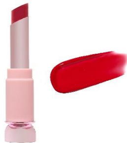
永遠ルビー 鮮やかな蛍光レッド