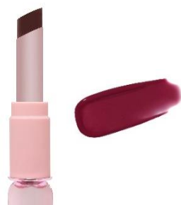
夜明けモーヴ ドリーミーダークモーヴ