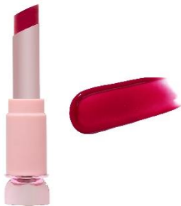
いちごローズ 抜け感のあるさわやか チェリーレッド