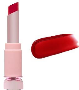
やきもちレッド コーラルローズレッド