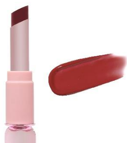
はちみつベージュ ドライフラワーのような 深みのあるベージュローズ