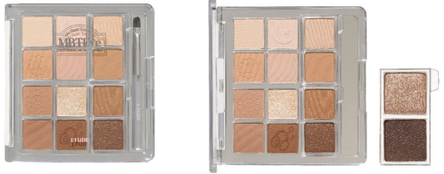
★ マイベストトーンアイパレット I (ウォーム / シャドウブラウン) パレット12色+入替用2色