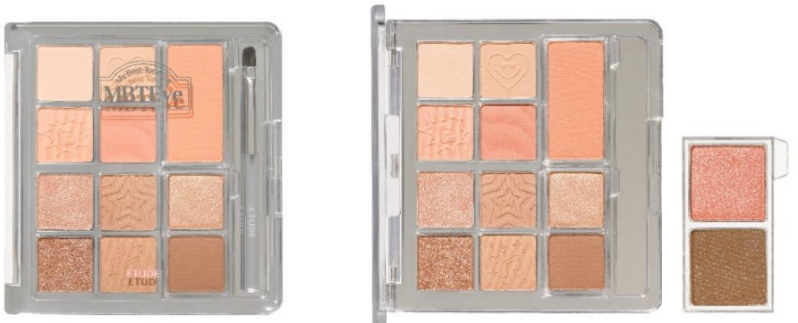
マイベストトーンアイパレット E (ウォーム / アプリコット) パレット10色+チーク1色+入替用2色