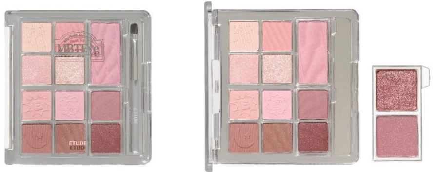
マイベストトーンアイパレット IE (クール / ピンクローズ) パレット10色+チーク1色+入替用2色