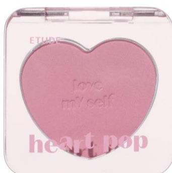
スクイズベリー (COOL/夏)

ミルクィなイチゴミルクに ブルーベリーを一滴たらしたような 甘酸っぱいピンクチーク