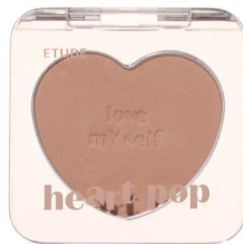
ボーントゥービーシック (WARM/秋)

ミルクィなイチゴミルクに ブルーベリーを一滴たらしたような 甘酸っぱいピンクチーク