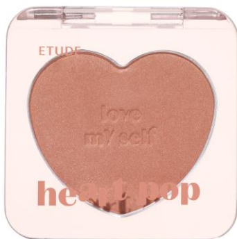
スーパーサンセット (WARM/春)