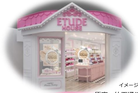
イメージ画像 ♥原宿・竹下通り店

愛らしいインテリアとあちこちに隠されたかわいい小物たち。 そんな、全ての「少女」が一度は夢見るドールハウスが ショップのモチーフです。