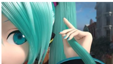
脱ツインテール！？髪飾りに手を掛け…