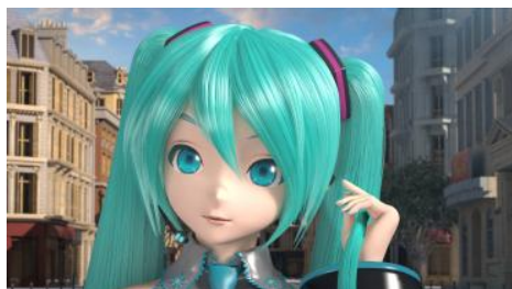
ちょっと浮かない表情で髪を触る初音ミクさん