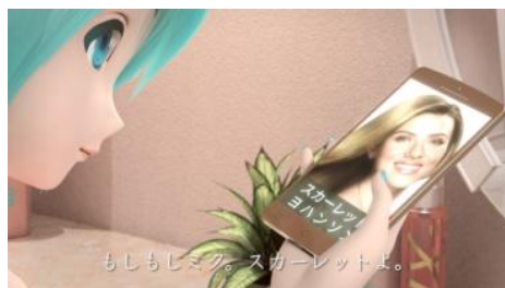
スカーレット・ヨハンソンさんから、ラブコールが！？