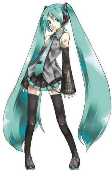
Illustration by KEI © Crypton Future Media, INC. www.piapro.net piapro