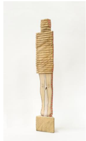
「sign」 檜、鉛筆、アクリル絵の具 h35×w10×d6 cm / 2017

石川は、意識的な形と、無意識のイメージを共存させることで「感じる／想像する」人間の感覚に問いかける作品の制作を行っています。2014年、弊社が主宰する第5回東京アンデパンダン展で人気投票上位者に、作品「package」が選出されました。この作品は、人が「そこに存在する気配」を主題とし、形態的・視覚的に人の表情や細部を覆い隠すことで「人体彫刻が観客側に干渉しすぎてこない佇まい」を木彫立体で表現しました。明らかな異形でありながらも作家にとっては「空間を彩る一輪の花のように心地良いもの」なのです。