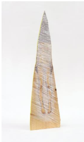
「sign」 檜、鉛筆、アクリル絵の具、 グリッター h38×w15×d5 cm / 2017