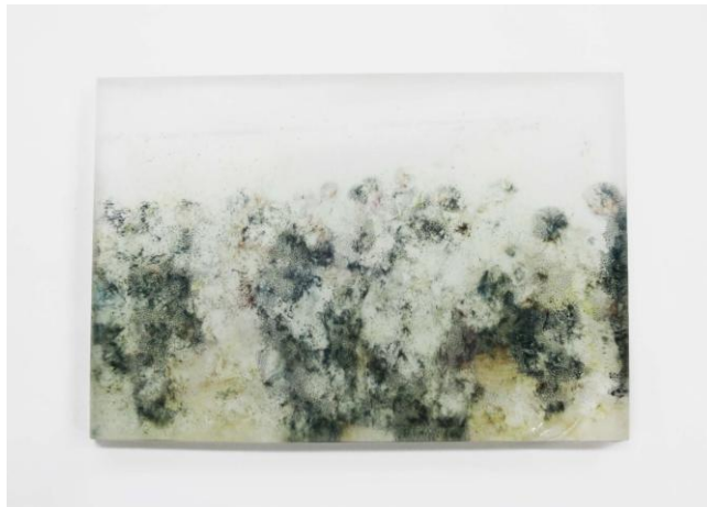
「active memory」透明樹脂、写真 h10×w15×d1 cm / 2017