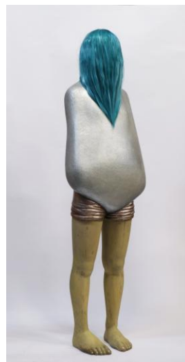
第5回東京アンデパンダン展受賞作品 「package」 桶、人工毛、グリッター 180×60×40cm / 2014

名称 : 石川慎平 個展「active」 アーティスト : 石川慎平 日付 : 2017年8月5日(土)～8月20日(日) ※毎週月曜休廊 時間 : 11:00～19:00 (最終日17時まで) 会場 : EARTH+GALLERY 〒135-0042 東京都江東区木場3-18-17 1F 主催 : 株式会社アースプラス URL : http://earth-plus.net/?p=8262 イベント : ・8月5日(土) 18:00～オープニングレセプション