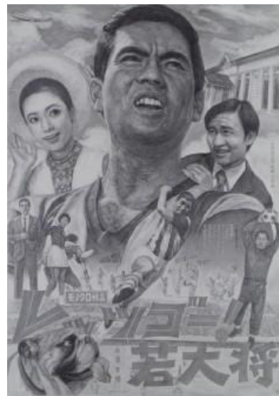
レッツゴー！若大将／加山雄三に褒められたくて （2008）鉛筆、サイン 146×103cm ペン

ながさわは2009年以降、「絵の力でチームの戦力になる」をコンセプトに、東北楽天ゴールデンイーグルス、東京ヤクルトスワローズ、千葉ロッテマリーンズといったプロ野球チーム全試合のハイライトを版画やペン画で描く『プロ野球画報』シリーズを中心に、制作活動に取り組んできました。また、野球のシリーズと並行して、自身が描きたい著名人のもとへ突撃取材し、その人物のポートレイトを版画で作成、モデル本人にコメントをもらって作品を完成させる『に・褒められたくて』シリーズの制作も行っています。