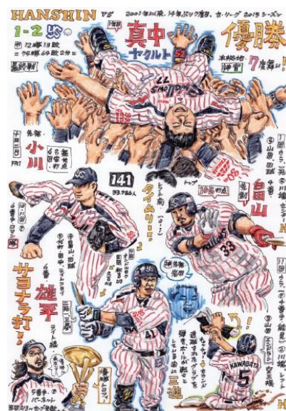
プロ野球画報 2015 No.141 (2015)

2008 アートプログラム青梅 2008 「空気遠近法・青梅-U39」 / 青梅市