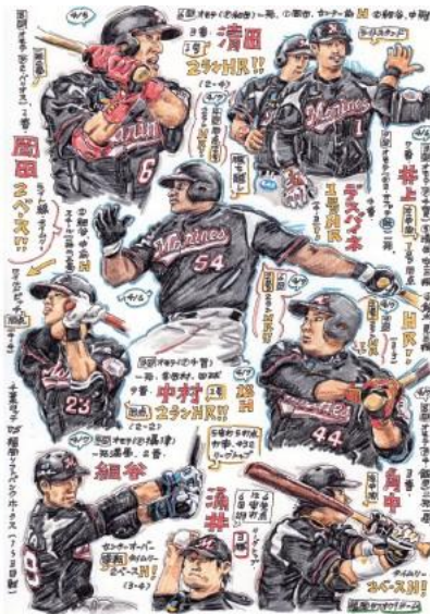
プロ野球画報 2016 ロッテ vs ソフトバンク 1～3 回戦（2016）ペン、色鉛筆 27×19cm

株式会社アースプラス（東京都江東区木場／代表取締役：松尾直樹）が運営する、EARTH+GALLERY（アースプラスギャラリー／東京都江東区木場）は、2017年1月29日（日）～2月12日（日）の期間、描く対象へ身を持って踏み込み、対話を重ね、版画やペン画を用いて作品を昇華させるアーティスト・ながさわたかひろによる、個展「レッツゴー！ながさわたかひろ、その愛のカタチ。」を開催いたします。1/29（日）の17:30～は、オープニングレセプション、同日16:00～と2/5（日）18:00～はゲストをお招きし、トークイベントを開催いたします。