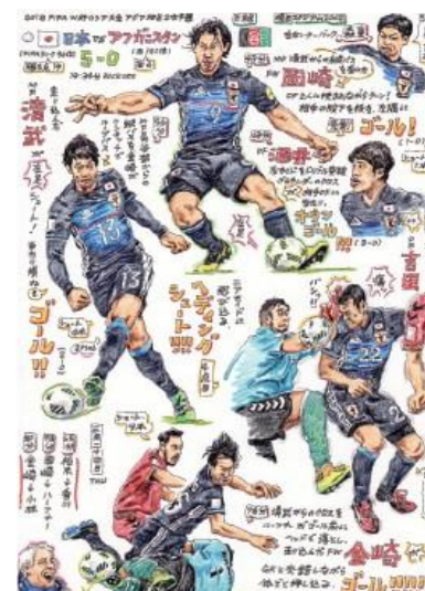
W杯アジア2次予選 日本 vs アフガニスタン (2016) ペン、色鉛筆 27×19cm