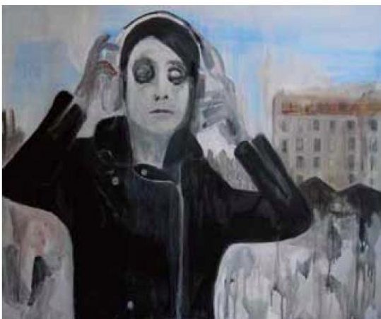
「Le Pont du Nord」1000x803mm キャンバスにアクリル 2013