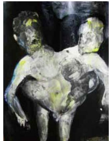
「Twins 02」297x420mm 水彩紙 アクリル、コンテ 2010