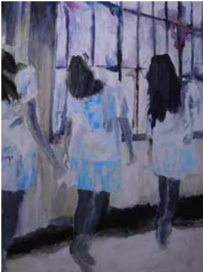
「非日常」1000x803 mm キャンバスにアクリル 2011