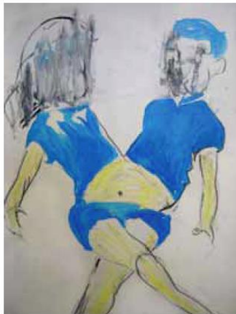
「Twins 01」297x420mm 水彩紙 アクリル、コンテ 2010