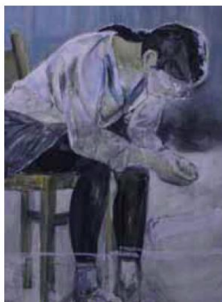
「思考」727x606mm キャンバスにアクリル 2009