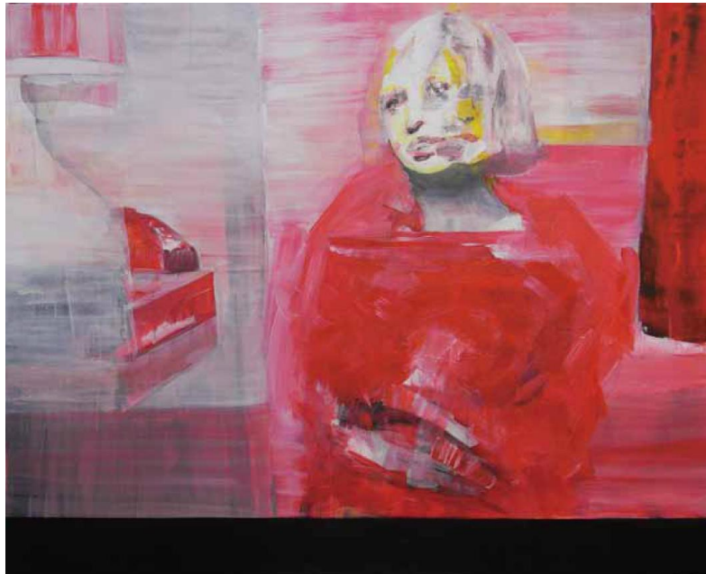
101x437-014411 150x130mm フォトリノ / フチキチノの展覧会白書2016