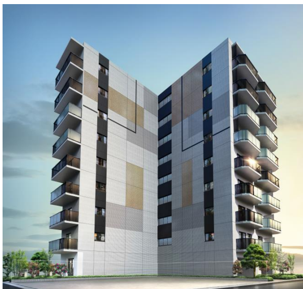
※画像はイメージです。 実際の物件とは異なる可能性があります。

投資用不動産を扱う株式会社グローバル・リンク・マネジメント（本社：東京都渋谷区、代表取締役社長：金 大仲、以下、GLM）は、4年連続して入居率99%以上を誇る自社ブランド「ARTESSIMO（アルテシモ）シリーズ」の新物件として「ARTESSIMO® LINO（アルテシモ リーノ）」の分譲を2019年1月7日（月）より開始します。