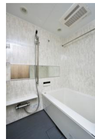
-シングルタイプ (1R) -