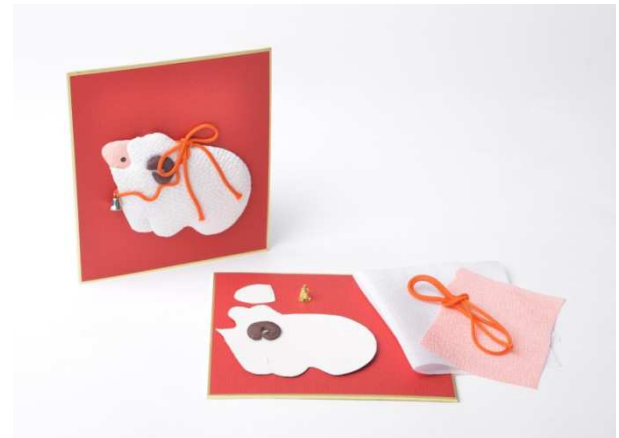
(左:江戸刺繍の半襟、右:久月人形学院指導による押し絵)

「江戸伝統工芸 職人実演」は2015年1月10日(土)～3月21日(土)までの隔週土曜日に、2Fロビーの特設スペースにて全6回開催いたします。刺繍と空間の間に粋なセンスが光る“江戸刺繍”や、江戸時代にブームで開花した日本伝統の製本技法“和綴じ”、羽子板の飾りに使われている“押し絵”など、江戸伝統工芸の職人をお招きして実演を行うとともに、体験レッスンを行います。華やかな江戸文化を育んだ技を現代に受け継ぐ職人の実演はもちろんのこと、“粋”の美学の結晶ともいえる工芸品の制作体験を通じて、「江戸の趣」をご体感ください。