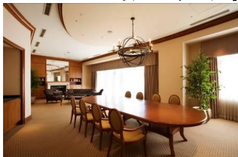
オーキッドルーム(90 m 2 )

親しい友人宅に招かれたような和やかで寛げる空間をテーマに設計。木の温もりを感じる、ダイニングテーブルとあわせソファセットもご用意。寛ぎの時間をお過ごしいただけます。