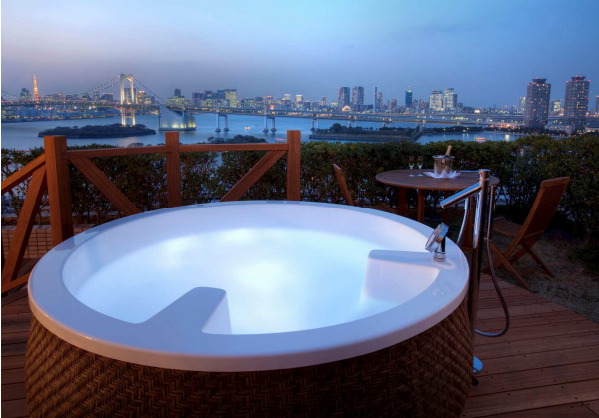
レインボーガーデンスイートの 屋外ジェットバス

コンチネンタルレストラン「テラス オン・ザ・ベイ」テラス席でのディナーや プライベートガーデンが付設されているレインボーガーデンスイートで ジェットバスをお楽しみいただける ホテル日航東京のテラスの魅力がぎゅっと詰まったプランです。