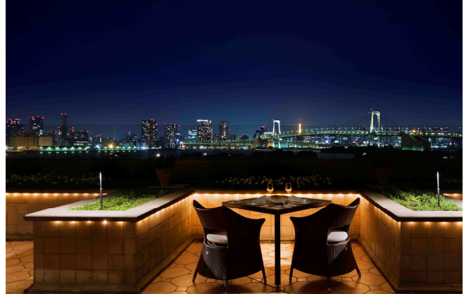
テラス席でのディナー