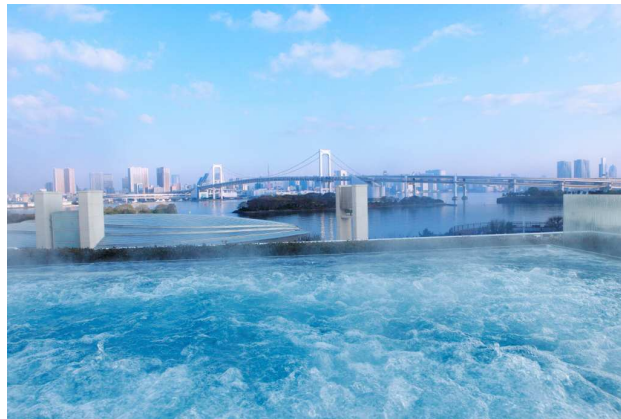
「SPA然 TOKYO」の 屋外ジェットバス