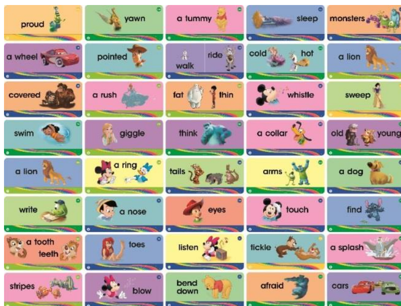
【新しいキャラクターによって生まれ変わったトークアロング・カード】

ワールド・ファミリー株式会社（本社：東京都中野区、代表取締役社長：ロバート・A・パーカー）は、幼児向け英語教材「ディズニー英語システム」をリニューアルし、4月17日（水）から全国で発売します。