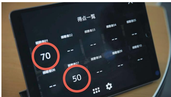
▲集合研修での受講者のVR視点をスコア化し、一覧で結果表示