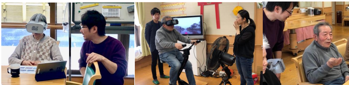
▲東北福祉会 せんだんの里にて行った回想法リハビリ VR のレクリエーションイベントの様子