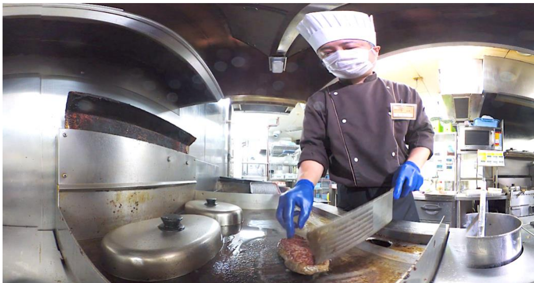
▲ジュウジュウと美味しそうな音をたててステーキを焼く、キッチンスタッフの疑似体験。

VRコンテンツ内では、接客だけではなく、「ステーキ宮」ではステーキの焼き方、「にぎりの徳兵衛」では寿司の握り方を、実際に働いている料理人の様子を通して見ることができます。また、来店者の喜ぶ顔や、美味しい料理を提供する仕事の楽しさも、実際の現場の雰囲気を通して体験させることで、求職者の興味喚起につなげていきます。