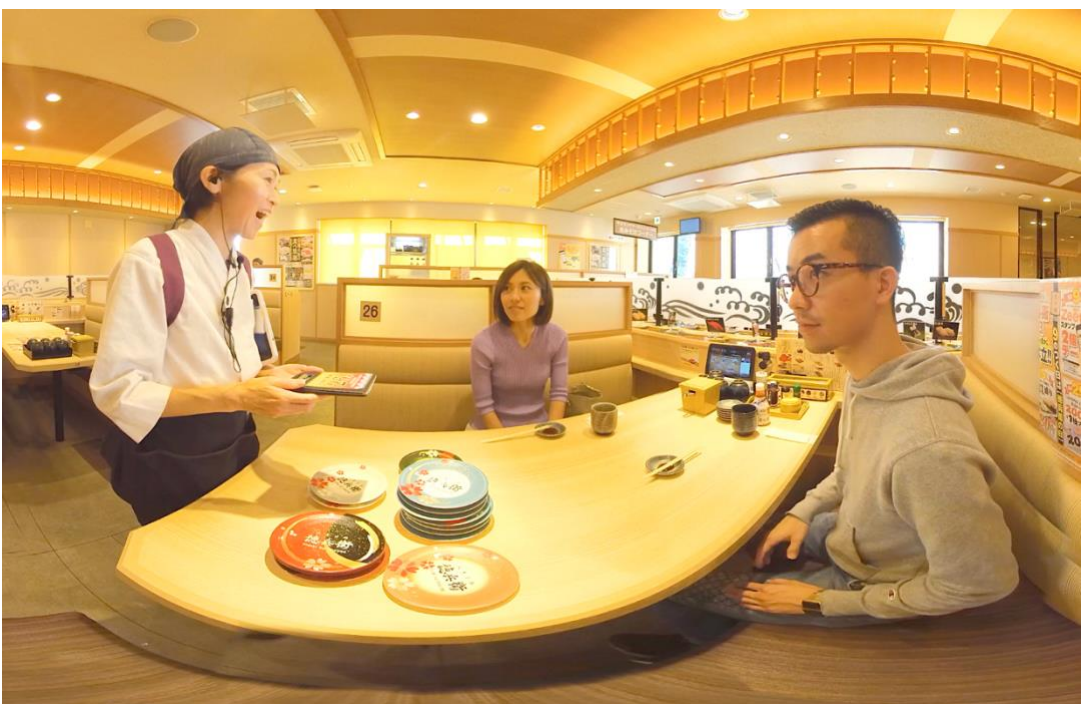
▲お皿を数える回転寿司ならではの接客シーンも。