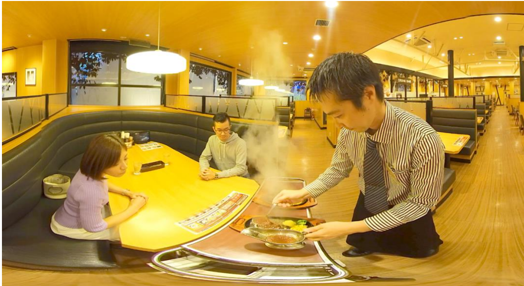
▲焼きたてのステーキに、特製ソースをかけて提供する先輩社員の様子。