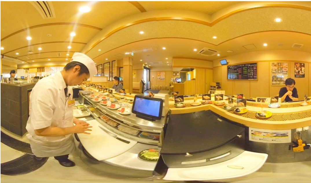
▲マシンを使った寿司の握り方も事前にVR体験することで、就業後の不安解消に。