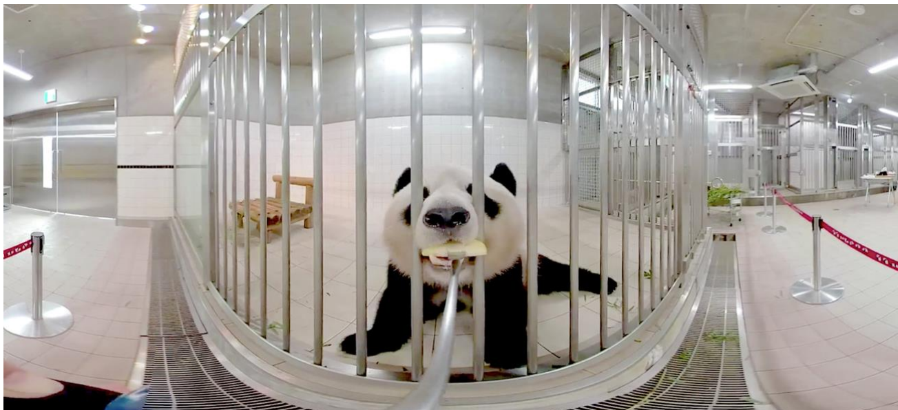
▲パンダへのおやつアーン体験ができちゃう！（※VR イメージ画像）

むことができます。これまで飼育スタッフやトレーナーでなければ体験出来なかった、超至近距離・大迫力の動物たちの姿を、高精細 VR 映像でお楽しみください。