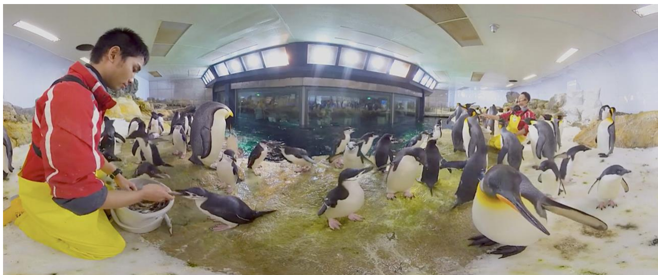
▲ペンギンに囲まれて飼育スタッフ体験をしながら、ペンギンの種類や特徴の解説も（※VR イメージ画像）