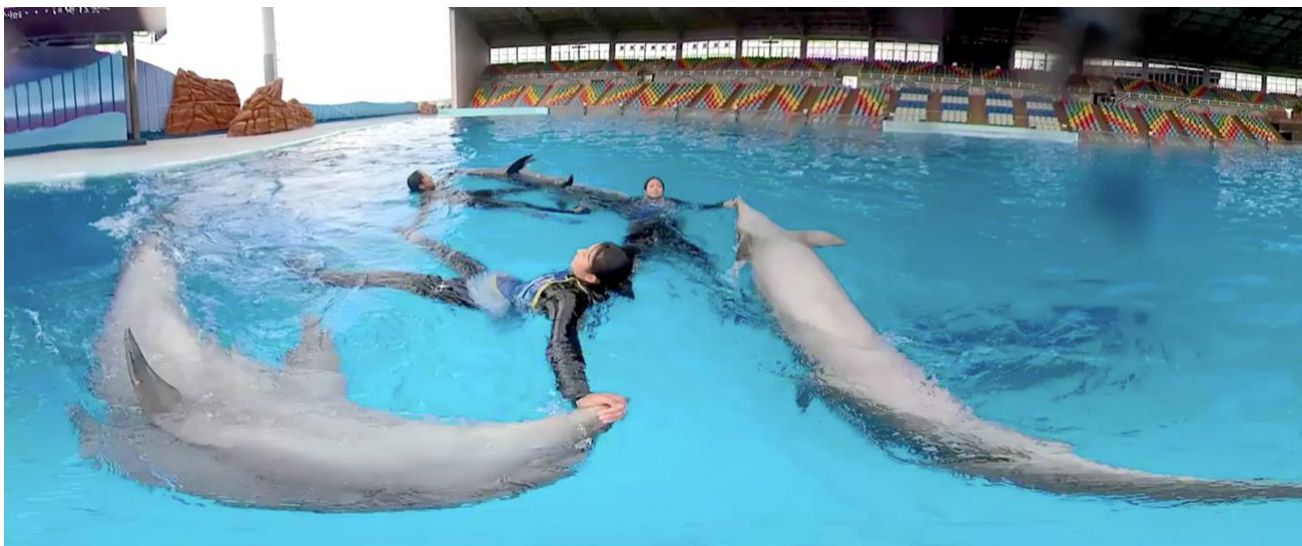
▲イルカとトレーナーの息の合った技の数々を 360 度体験（※VR イメージ画像）