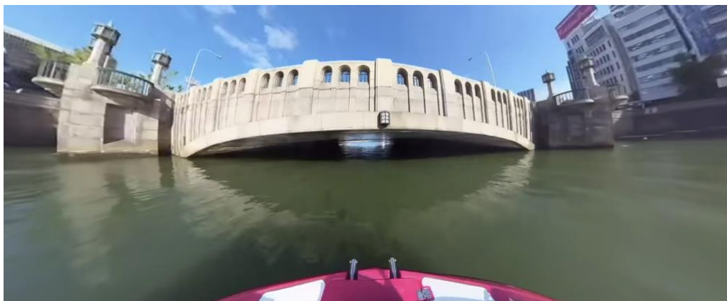
▲思わず首をすくめてしまいそうなほど低い淀屋橋の下をくぐり抜け体験！

「水都大阪 VR クルーズ」は、水辺を彩る光のまち“水の都”大阪の魅力を広くユーザーに伝え、新しい大阪の楽しみ方をアピールしていきます。