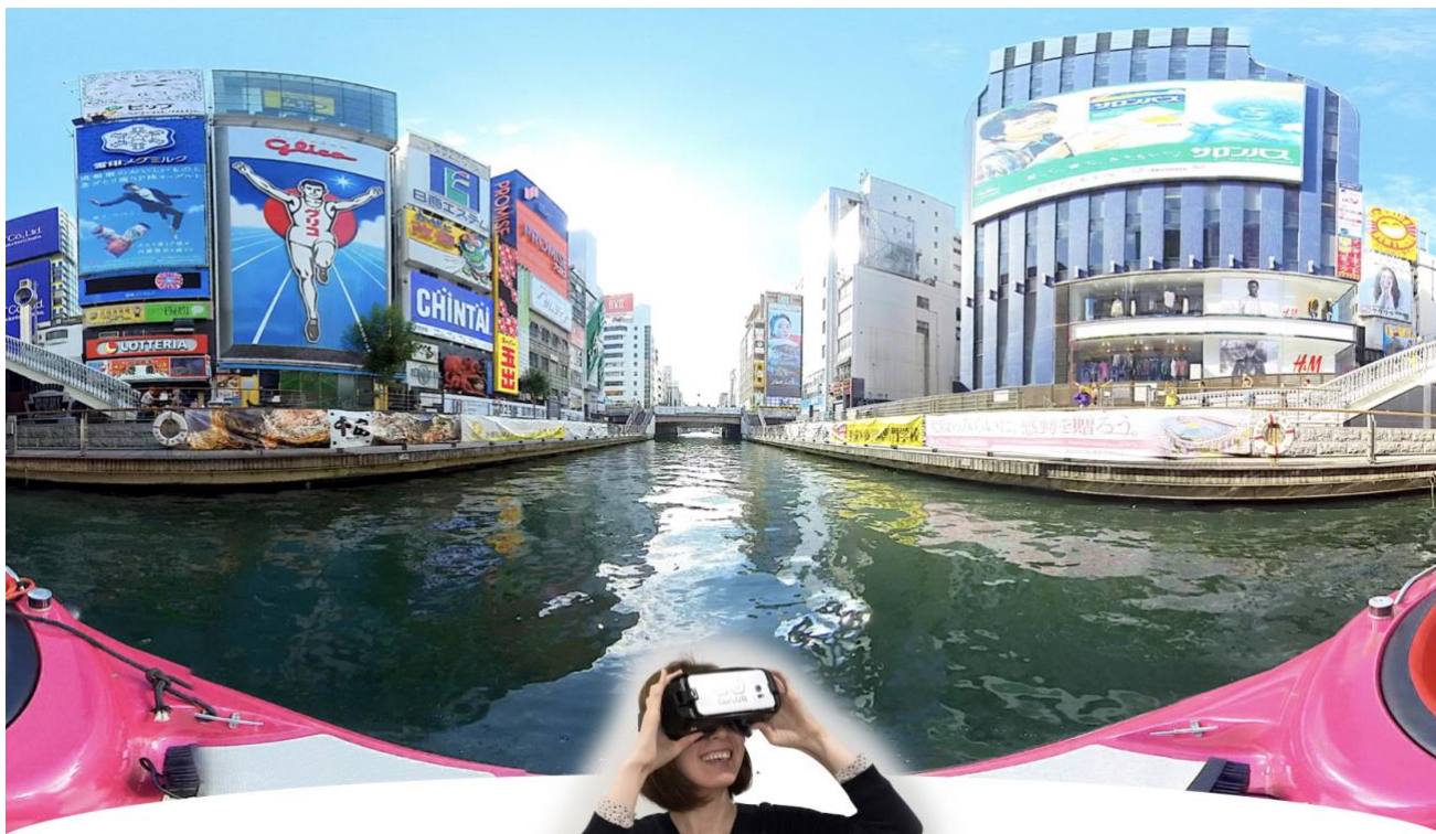
▲大阪の街をぐるりとクルージング！昼・夜の絶景を360度楽しめる！（※VRイメージ画像）

また「水都大阪 VR クルーズ」は、10月20日（土）から開催の「水都大阪フェス 2018」にて体験展示を行います。