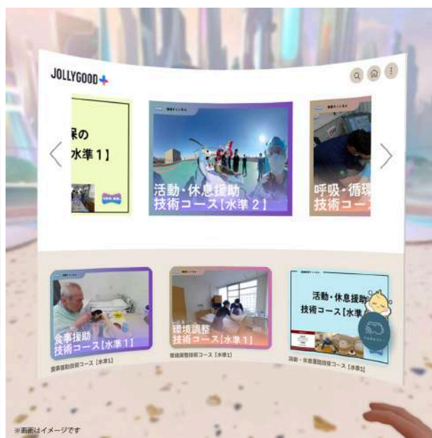
【Meta Questでの利用イメージ】