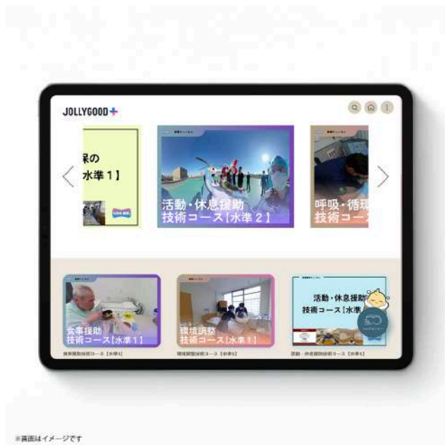
【iPadでの利用イメージ】