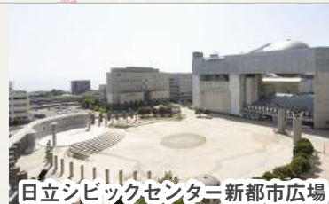
日立シビックセンター新都市広場