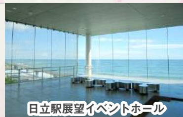
日立駅展望イベントホール