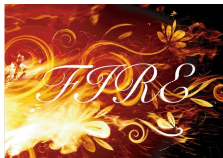
【Iolve】 Fire lolve幻のレッスン！

体の背面に徹底的にアプローチし、360度どこから見ても美しい引き締まったボディに！