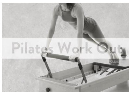
【pilates K】 Pilates Work Out

背中、二の腕を中心に引き締め洗練された、後ろ姿まで抜かりないボディを作りあげます ※オンラインレッスンではサーフボードは使用しません