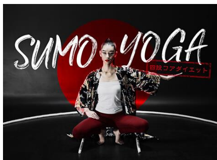
【Iolve】 SUMO YOGA ～四股コアダイエット～

「相撲」と「ヨガ」を掛け合わせた最新ダイエットヨガ！四股の動きでコアの筋肉を鍛えていきます