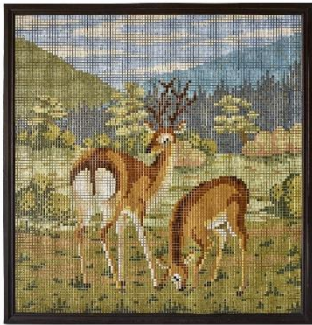
写真4：ラスモザイク壁画「鹿」 1935（昭和10）～1940（昭和15）年頃 W1705×D32×H1770mm LIXIL蔵

戦後は衛生陶器など水まわりに関わる製品の開発製造へと展開しました。後に、新素材として注目されていたFRPに着目し、試行錯誤の末、1958（昭和33）年にポリバス（FRP浴槽）を開発。軽く施工が楽なこの素材を進化させながら「バランス釜」（写真5）などの新商材が生まれます。また、1967（昭和42）年には国産初の温水洗浄機能付便器「サニタリイナ61」（写真6）を発売。技術者たちが未経験の新しい機能開発に悪戦苦闘の結果、生み出した画期的な製品をご紹介します。