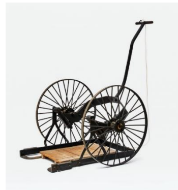
写真 3：伊奈式運搬車

1888（明治 21）年 W620×D280×H356cm LIXIL 蔵