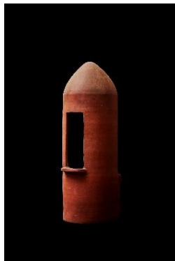
写真 2：家外小便所 復元品

19 世紀（江戸時代末期） W65×D70×H80 mm 中村眞二蔵