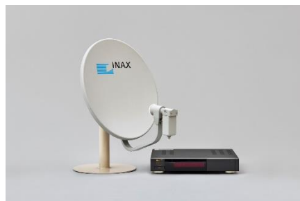
写真9（右）：パラボナアンテナとチューナー 1988（昭和63）年頃 アンテナ W360×D600×H540mm チューナー W340×D320×H65mm LIXIL蔵