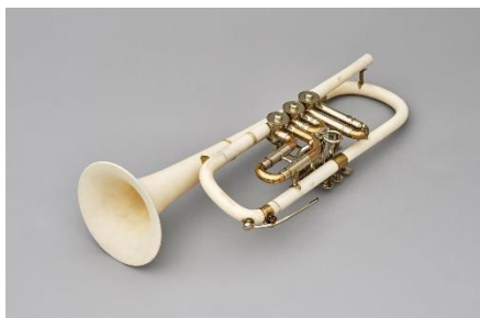
写真8（左）：セラミックス楽器「トランペット」 1989（平成元）年頃 W460×D205×H205mm LIXIL蔵

やきものの孔の形状や量をコントロールし、機械加工が可能な機能素材「マシナブルセラミックス」を開発し、1989（平成元）年に名古屋で開催された世界デザイン博覧会においてセラミックス楽器（写真8）に応用しました。また、FRPの軽くて錆びない特性と、浴槽づくりで培った技術と経験をもとに「パラボナアンテナ」（写真9）を開発。国内だけでなく国際的にも注目を集めます。いずれも事業は継続しませんでした。技術者の研究から誕生した開発事例にもスポットをあてます。