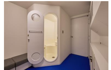
写真7：中銀カプセルタワービル内部。ユニットバスの扉をあけた様子

建築家・黒川紀章の設計により、1972（昭和47）年に東京・銀座に竣工した〈中銀カプセルタワービル〉は、140基の着脱可能なカプセルユニットで建築運動「メタボリズム」の傑作といわれています。そのユニットバスを手がけたのが伊奈製陶でした。ほぼ納材当時の仕様のまま現存するカプセルが「どろんこ広場」に登場。内部空間は円型窓越しにご覧いただけます。