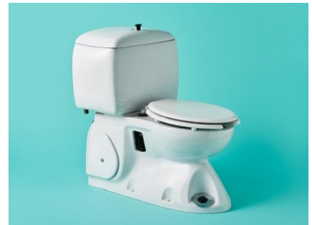
写真6：サニタリイナ61 1967（昭和42）年 W470×D800×H830mm LIXIL蔵