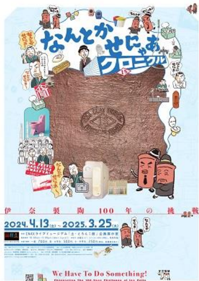
企画展ポスター画像

株式会社 LIXIL（以下 LIXIL）が運営する、土とやきものの魅力を伝える文化施設「INAX ライブミュージアム」（所在地：愛知県常滑市）では、2024年4月13日（土）から2025年3月25日（火）まで、企画展「なんとかせにやあクロニクル—伊奈製陶 100 年の挑戦—」を開催します。2024年、LIXIL の水まわり・タイル事業は 100 周年を迎えます。本展では、1924 年に設立した伊奈製陶から INAX（現 LIXIL）に至るものづくりの歴史を、年表とエポックメイキングな製品や技術など 100 点以上の実資料で展覧し、先人たちの創意工夫をひも解きます。