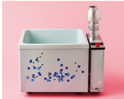
写真5：バランス釜（ポリセット） 1981（昭和56）年 W980×D700×H1030mm LIXIL蔵