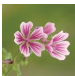
ゼニアオイエキス