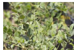
油溶性甘草エキス

独特の甘みがあることから甘草 (カンゾウ) と呼ばれる植物の根 から得られるエキス