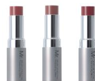
ミスター マルチ コンプレクション スティック 全3色 3.4g 1,700円 (税込 1,870円)