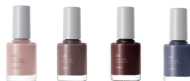
ミスター ネイルケアプロテクター 全4色 10ml 1,200円 (税込 1,320円)