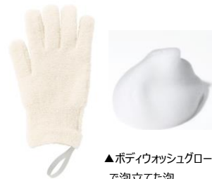
▲ボディウォッシュグローブで泡立てた泡

なめらかな肌触りを実現するシルク（絹糸）、とうもろこし由来の「ポリ乳酸」を組み合わせた、オリジナル素材。水分を含ませ、もみこむと、繊細なとろみ泡が。ふわ、とろつとした泡に包まれ、楽しみながら体をすみずみまで洗うことができ、すすぎ後はすっきり、しっとりつるつるの後肌感。